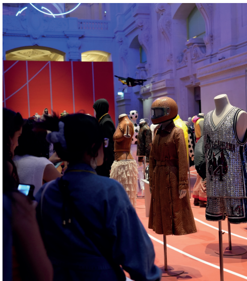
EXPOSITION « MODE ET SPORT, D'UN PODIUM À L'AUTRE »