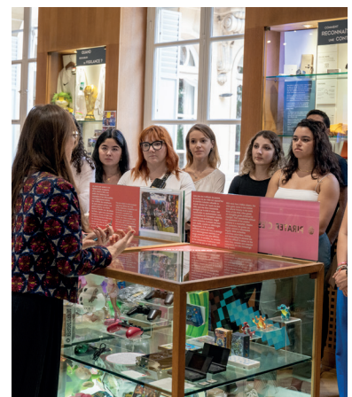
MUSÉE DE LA CONTREFAÇON

Parmi les nombreux points abordés, la visite guidée a mis l'accent sur le droit. Les étudiants ont été initiés aux lois relatives à la propriété intellectuelle, mettant en lumière les enjeux auxquels les maisons de luxe sont confrontées dans leur lutte contre la contrefaçon. La visite a également élargi la perspective des Ms1 au-delà de la simple imitation de sacs de luxe. Ils ont découvert que la contrefaçon concernait de nombreux autres secteurs, tels que les produits pharmaceutiques ou électroniques.